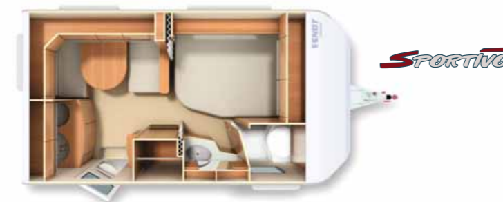
390 FH Sportivo