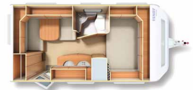
450 SQB Sportivo